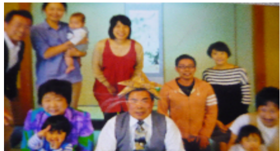
孫に囲まれて古希の祝宴