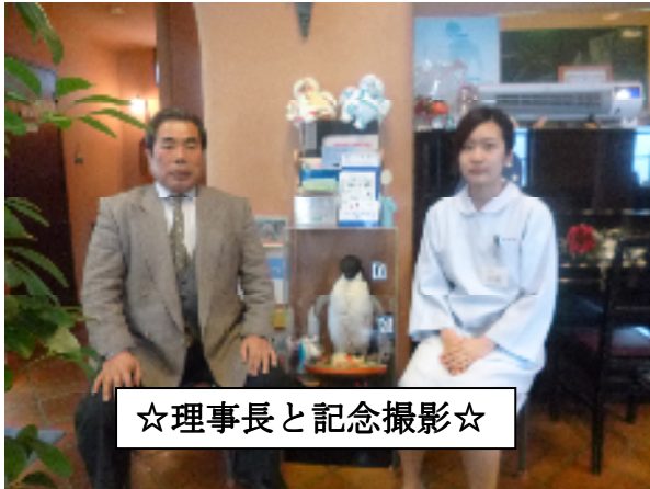
☆理事長と記念撮影☆