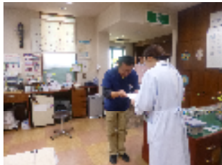
←院長より 辞令の授与