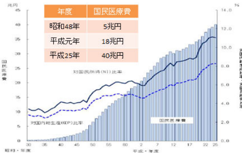
図1 国民医療費・対国内総生産及び対国民所得比率の年次推移

治せる病気は最善を尽くして治したい。しかしその治療費は国民全体で税金と保険料で支え合っている以上、治療費が増えるほど税金や保険料の負担は当然増えます。右下のグラフにあるように、私が生まれた昭和48年度の国民医療費は5兆円だったのが、今は40兆円を超えています。このまま右肩上がり医療費が増大していけば100兆円を超える日はそう遠くはないでしょう。